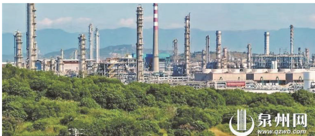
福建聯合石化公司2023年入選國家級“綠色工廠”(福建聯合石化供圖)

泉州網訊(融媒體記者陳林森 通訊員翁曉軍)泉州北翼,湄洲灣畔,福建聯合石化公司塔林罐叢屹立在泉港石化工業園區。從鄉野村居到千億石化產業基地,自上世紀90年代初至今,福建聯合石化公司見證了泉州石化產業翻天覆地的巨變,也從中得以滋養成長為一艘千萬噸煉油、百萬噸乙烯的石化巨輪。