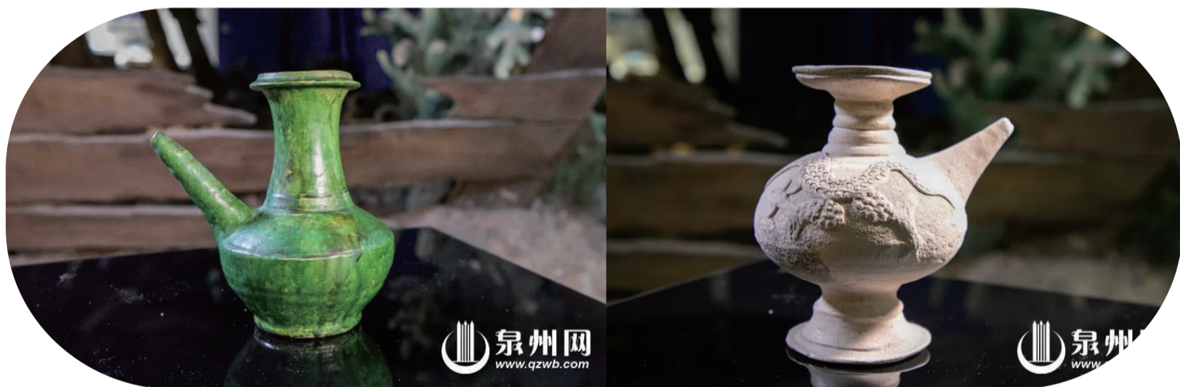
宋元磁甕窰綠釉軍持